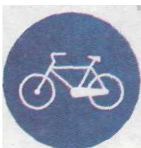
Доріжка для велосипедистів