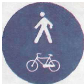
Доріжка для пішоходів і велосипедистів