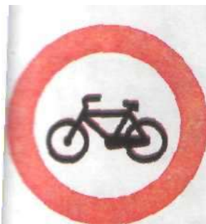
Рух на велосипедах заборонено