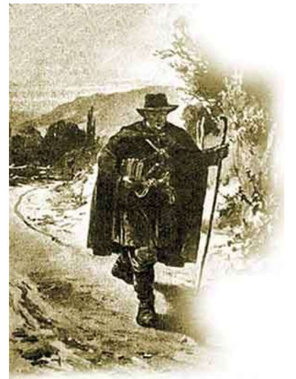
Мал. Г. Сковорода –

- Опираючись на портретні зображення, спробуйте створити психологічний портрет Г. Сковороди.