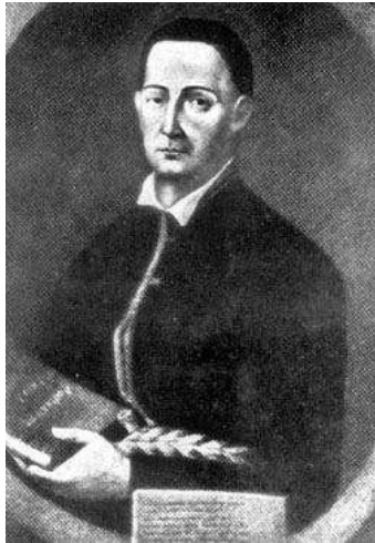
Худ. Лук'янов Г. Прижиттєвий портрет Г. Сковороди. 1794 р.