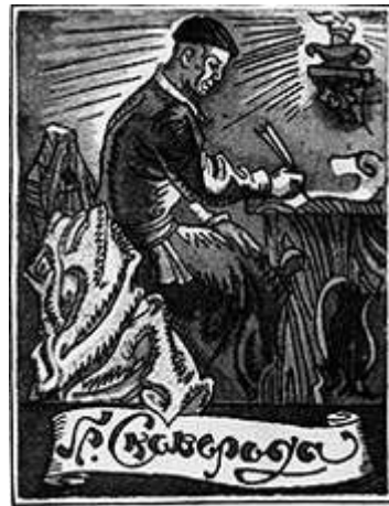
Офорт. Г. Сковорода.